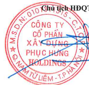
Cao Tùng Lâm