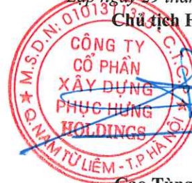
Cao Tùng Lâm